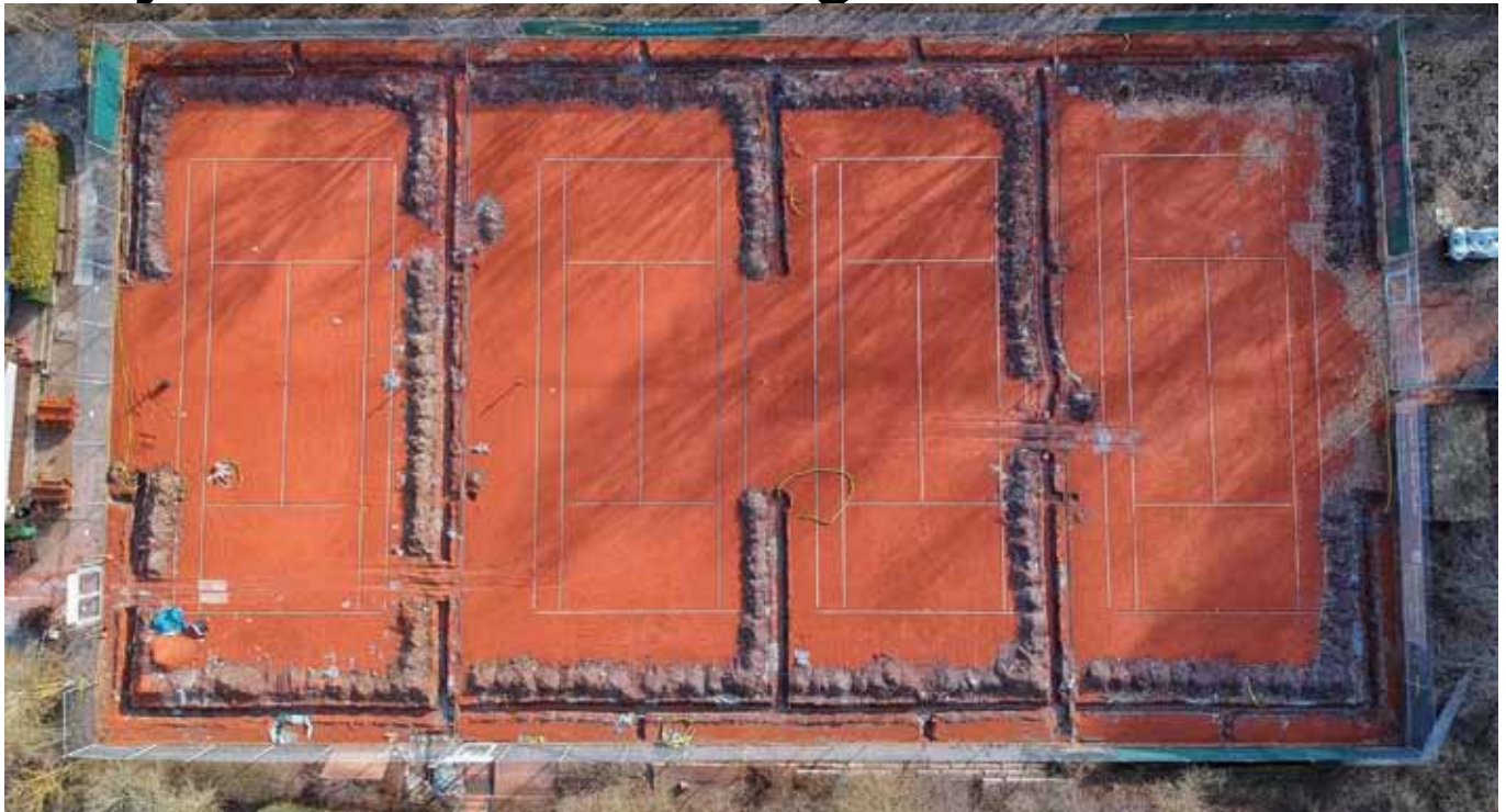
Professionelle Beregnungsanlage der Tenniscourts kurz vor der Fertigstellung.

Liebe Mitglieder der Tennisabteilung, schon bald ist es wieder soweit, dass wir unsere Schläger schwingen können. Aber davor müssen Plätze und Anlage wieder